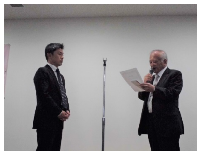
理事長と表彰者とドラ隊と共に

鎌倉リハビリテーション聖テレジア病院 「Welwalk 導入による当院の取り組み」