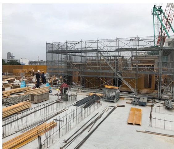
屋上階搭屋躯体工事