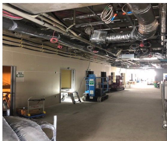
内部工事状況（1階外来）