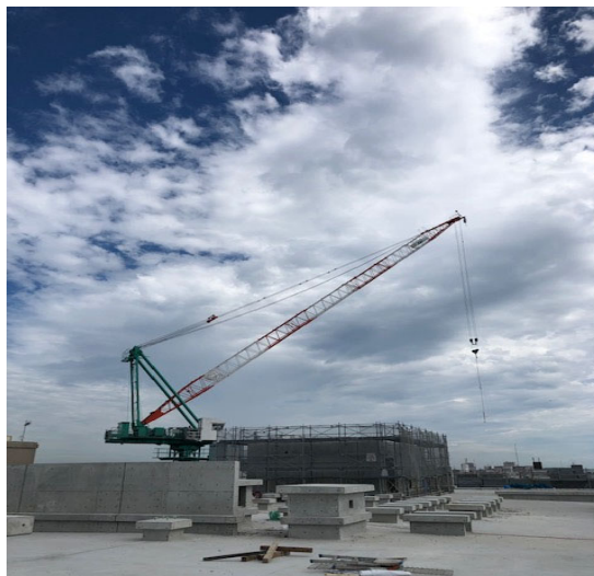
屋上階搭屋躯体工事