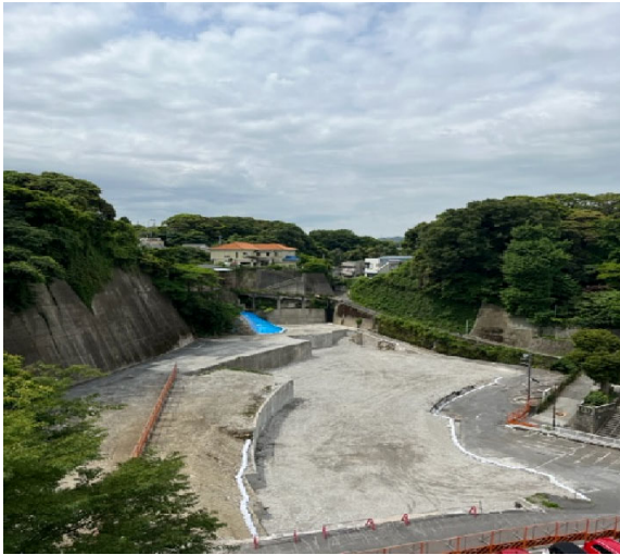
令和5年5月25日 解体後

旧病棟跡地が更地となり駐車場工事を経て現在は建物の躯体工事を行っています。上棟は5月中旬を予定しています。