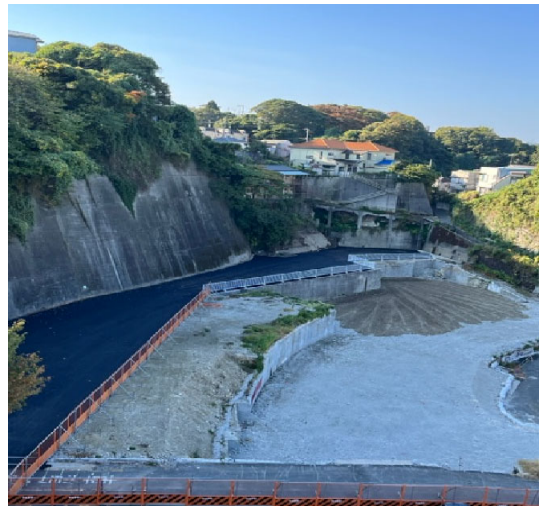
令和5年11月4日 駐車場工事