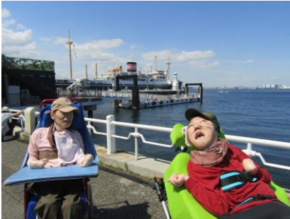
横浜港で大きい船発見！