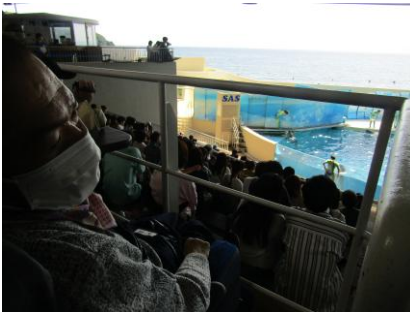
イルカショーを見ました 🐬🎵