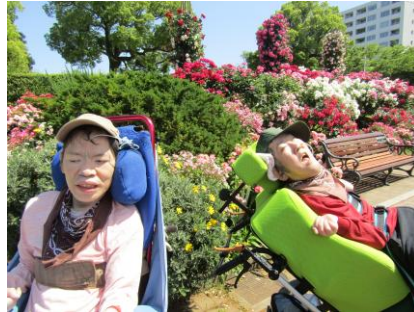
山下公園、お花が綺麗でしたね♪